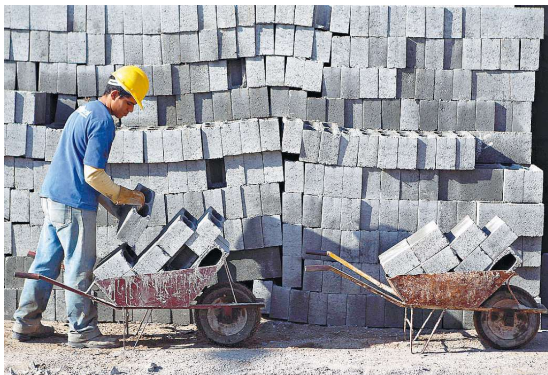
De 2009 a 2011, Prefeitura aprovou mais de 1,5 milhão de metros quadrados em construções no Município