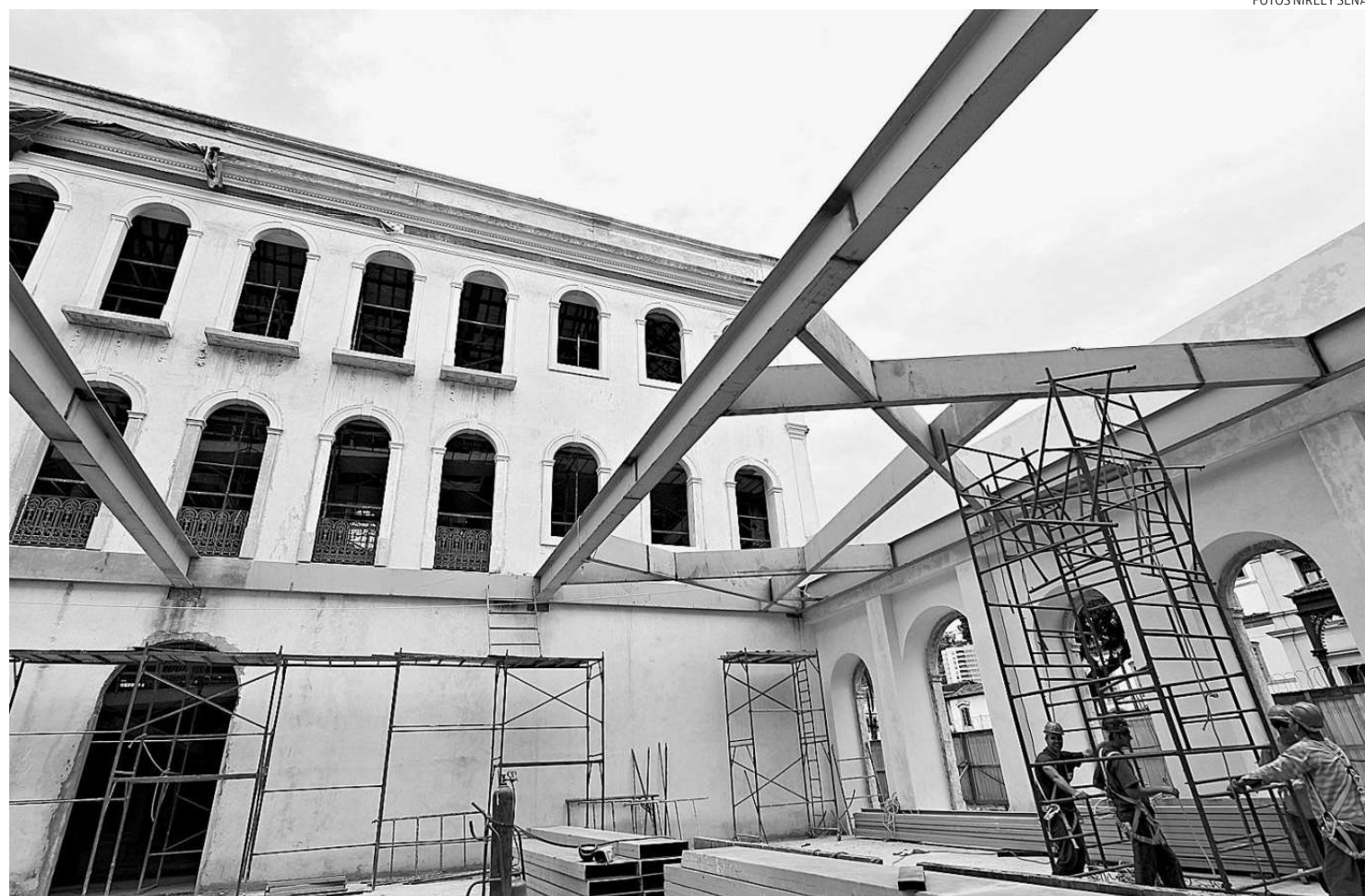
O Museu ocupa o antigo Casarão do Valongo, cuja fachada foi restaurada. Pelo cronograma, a parte estrutural deve ser finalizada em janeiro

O diretor da Ama-Brasil, Organização da Sociedade Civil de Interesse Público (Oscip) responsável pela captação dos recursos para o Museu Pelé,