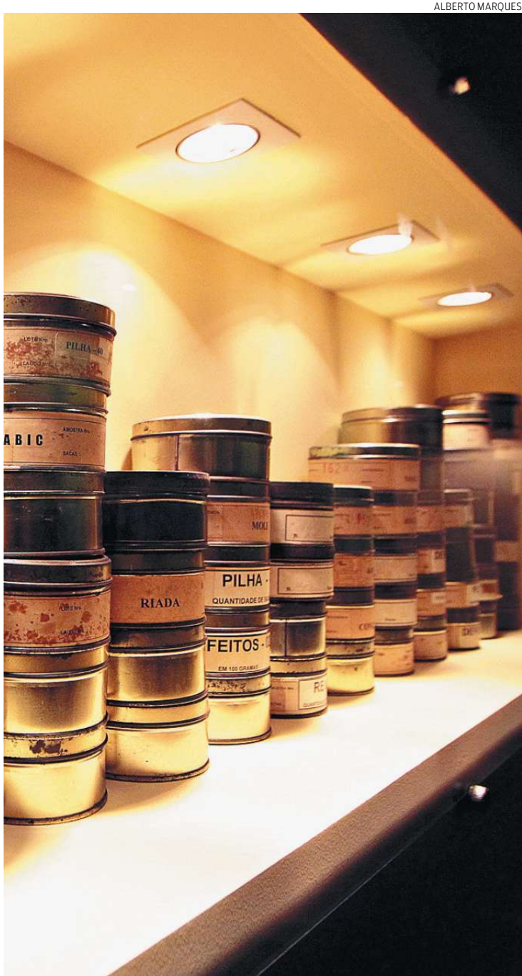
Objetos que faziam parte da rotina na época de ouro para o grão

Exposição inaugurada no Museu do Café traduz, em imagens e objetos, a importância do grão na economia e política deste século