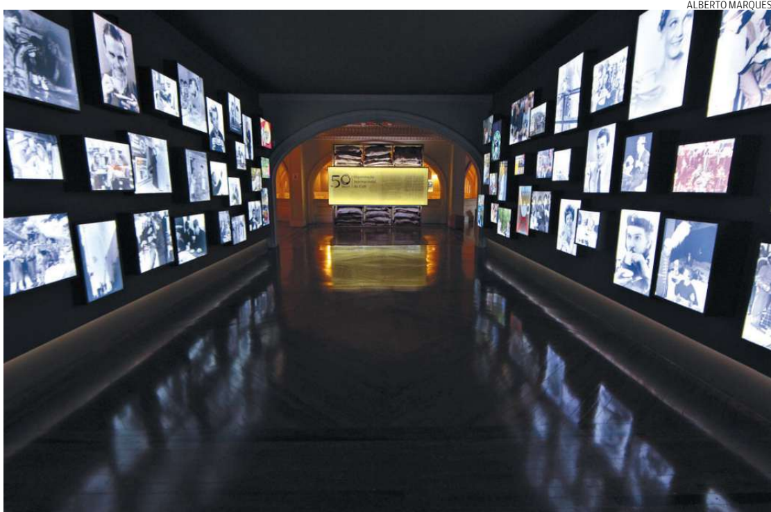
Imagens de celebridades, líderes políticos e donas de casa tomando a bebida criam um túnel do tempo