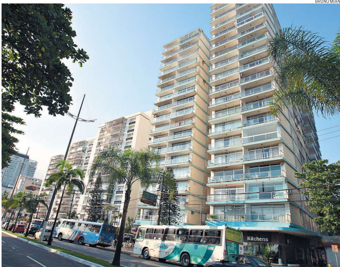
Trecho da Avenida Vicente de Carvalho, no Gonzaga: nova Planta Genérica alterou valores de imóveis

Foi feita pesquisa de mercado de apartamentos à venda em determinada área, identificado o volume de imóveis à venda no local e elaborado um