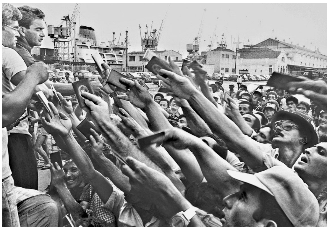
Vista geral da orla santista no amanhecer, num trabalho recente de Araquém; torre da Bolsa do Café flagrada do alto, e imagem dos trabalhadores do Porto de Santos feita em 1973