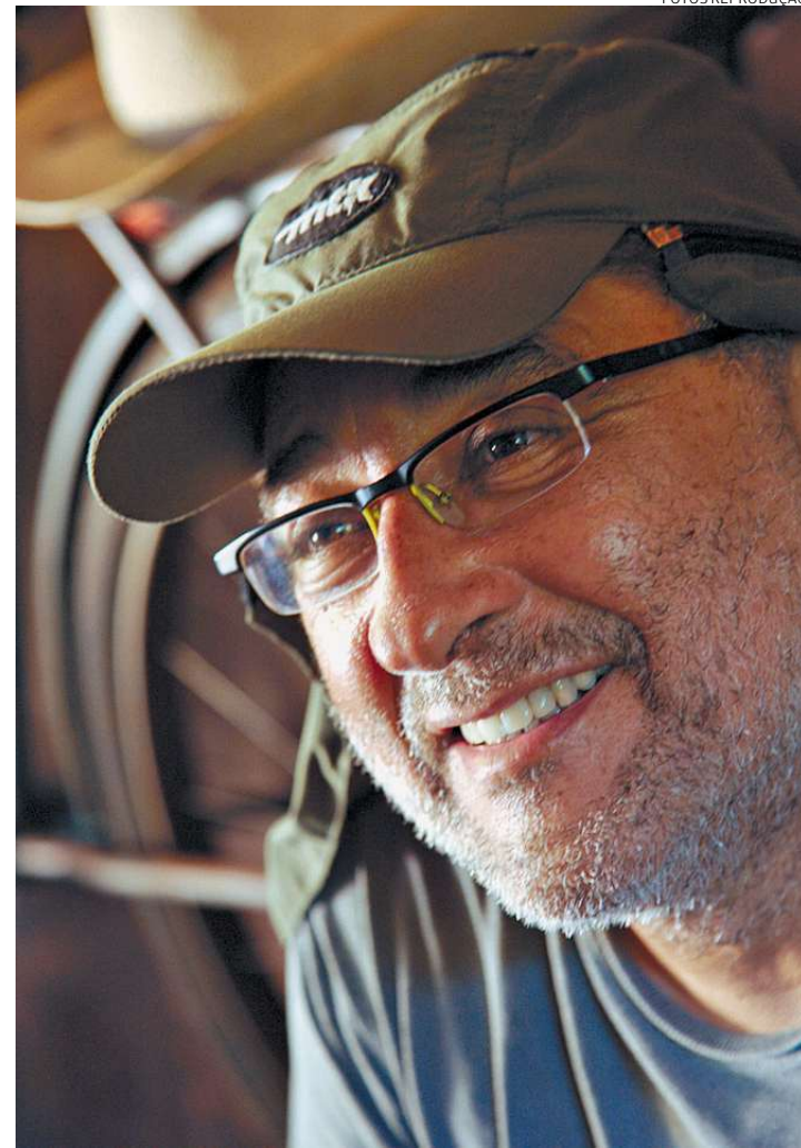
Araquém registra a Cidade desde 1970 em fotos em preto e branco

Como exemplos recentes do impacto da desertificação no Brasil, o fotógrafo lembra de suçuaranas (onça-parda) que atravessam avenidas em Campos do Jordão, uma onça pinta-