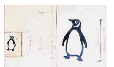
Recriação. Logo da Penguin