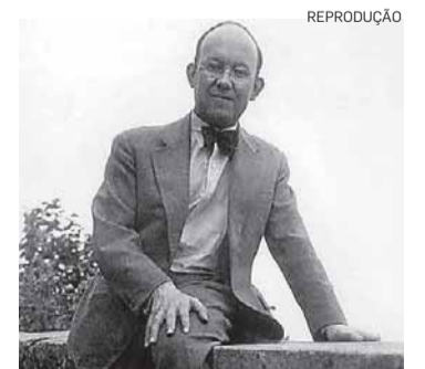
Gênio. Tschichold em 1938

sem serifa. Em 1947, quando trabalhou para a Penguin Books de Londres, ele estabeleceu normas de composição que refletem uma atitude conservadora, embora não tenha deixado de criar lindas capas de livros e, naturalmente, dado forma final ao pinguim original de Edward Young, marca da editora. O livro da Edusp traz o melhor da produção visual de Tschichold, como os cartazes dos anos 1920 para filmes (como Napoleão , de Abel Gance) e exposições dos amigos (Emil Nolde, entre eles). Uma obra essencial para alunos de design. A.G.F.