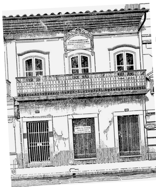
Da antiga casa de José Bonifácio, localizada na Rua XV de Novembro esquina da Frei Gaspar, muito pouco restou conforme prova o desenho ao lado

nesses tempos de poucos conhecimentos em puericultura e medicina era comum mesmo entre famílias nobres e abastadas.