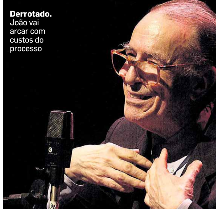
Derrotado. João vai arcar com custos do processo

João Gilberto também vê “calúnia e difamação” no trabalho, dizendo que o autor passa uma ideia de “homem displicente no cumprimento de suas obrigações trabalhistas, de alguém que emite conceitos desfavoráveis a outras figuras artísticas” e que João é “acometido de neurose obsessiva e paranoia”, desmoralizando-o.